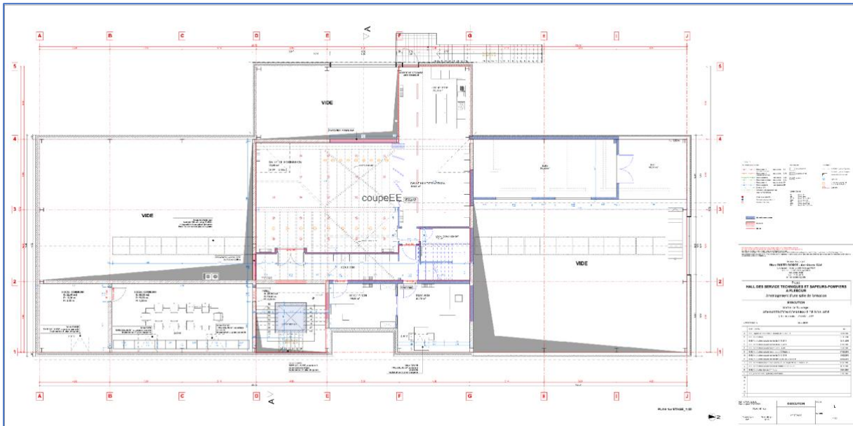
Tableau 30: Plan architectural des locaux du bureau situé à 39, rue Fleboul à Baschleiden (cf. annexe email)