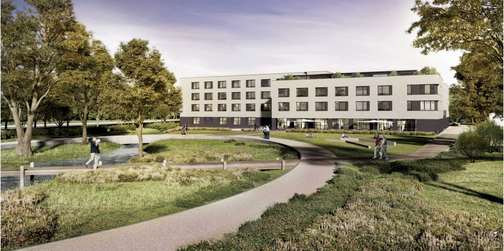
© FABECK Architectes - ARCO Architecture Company - Image3G