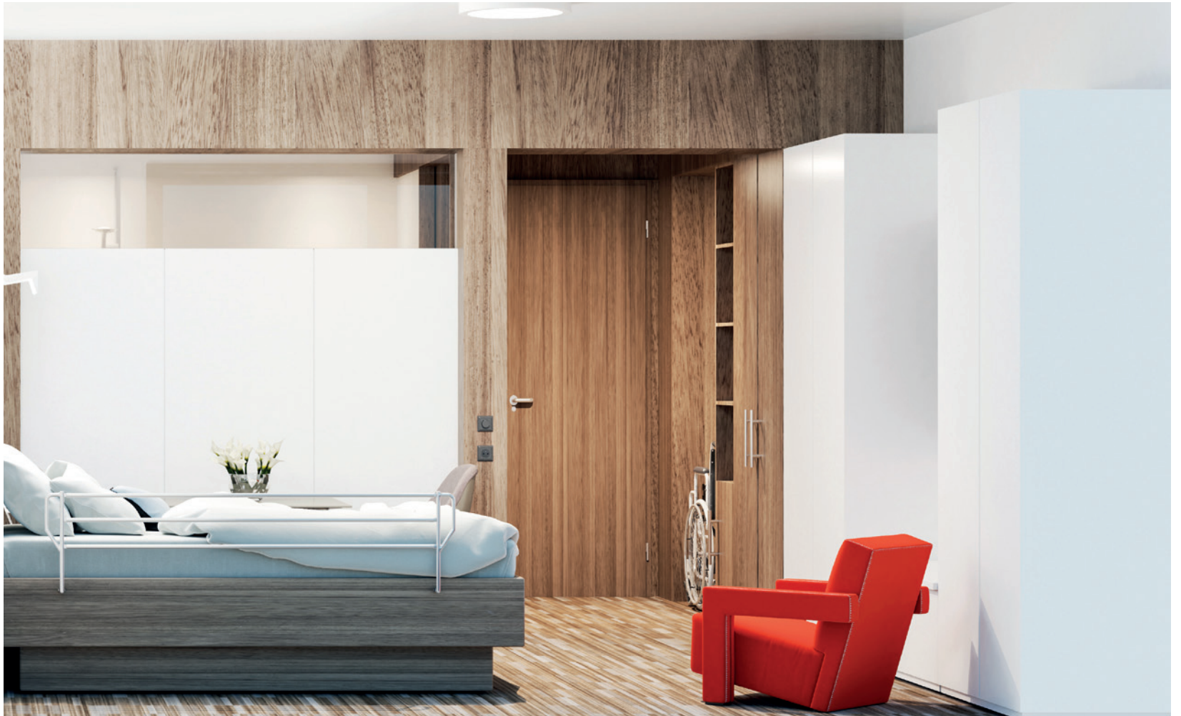
© FABECK Architectes - ARCO Architecture Company - Image3G