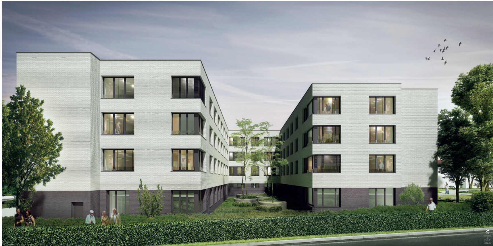
© FABECK Architectes - ARCO Architecture Company - Image3G