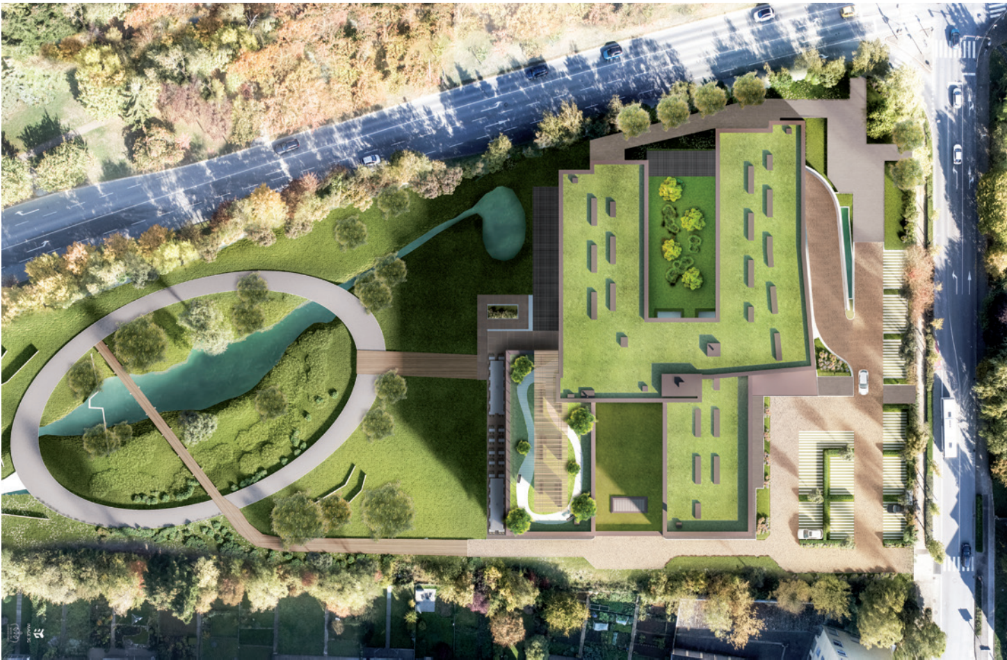
© FABECK Architectes - ARCO Architecture Company - Image3G