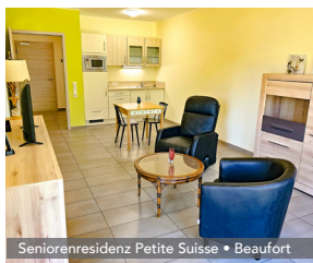
Seniorenresidenz Petite Suisse • Beaufort