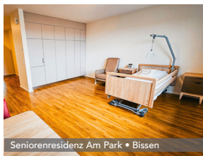
Seniorenresidenz Am Park • Bissen