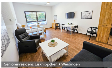
Seniorenresidenz Eisknippchen • Weidingen

Nos équipes pluridisciplinaires vous accompagnent 24h/24 au besoin et assurent une prise en charge de qualité afin de garantir un séjour sans soucis.