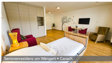
Seniorenresidenz am Wéngert • Canach