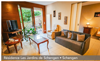
Résidence Les Jardins de Schengen • Schengen