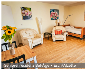
Seniorenresidenz Bel-Âge • Esch/Alzette