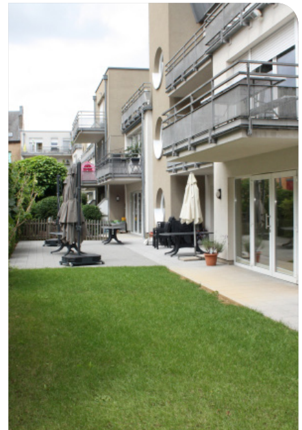
Foyer Espérance, Esch/Alzette