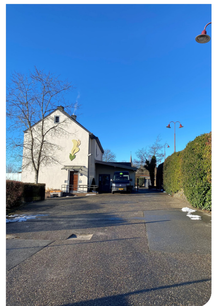
Foyer Gënzegold, Dahl