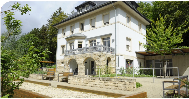
Foyer Villa Reebou, Düdelingen