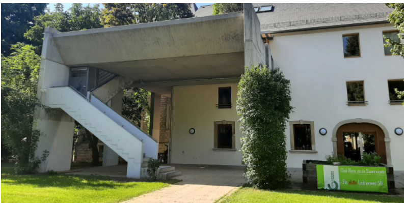
Foyer Minettsheem, Rümelingen