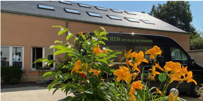
Foyer Bonnevoie, Bonneweg