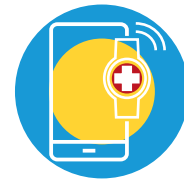
ROUDE KNAPP TÉLÉALARME • TELEALARM PROCHAINEMENT DISPONIBLE • DEMNÄCHST VERFÜGBAR