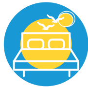
LITS DE VACANCES URLAUBSBETTEN