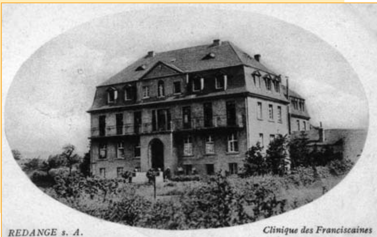
REDANGE s. A.

2007 waren fast alle Arbeiten abgeschlossen und das Home pour Personnes Agées St-François in Redingen entspricht fortan den Bedürfnissen eines Altenheims des 21. Jahrhunderts.