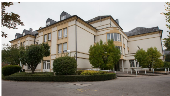
Maison Regina Pacis

L'association sans but lucratif MAREDOC est une institution privée dont l'objet est la gestion des Maisons de Retraite des Soeurs de la Doctrine Chrétienne au Luxembourg. Fondée en 1993, elle gère actuellement un centre intégré pour personnes âgées (CIPA) qui offre l'hébergement à 141 personnes âgées et/ou nécessitant des soins :