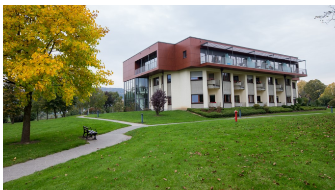
Maison Marie Consolatrice