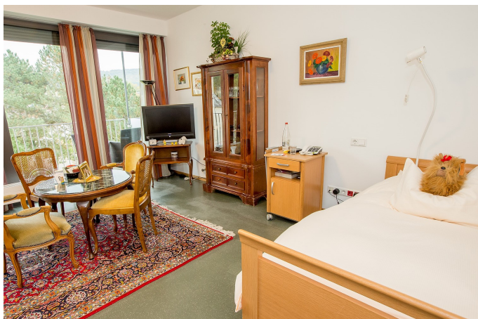
Exemple de logement

Vous pouvez personnaliser votre logement en apportant du petit mobilier, des éléments décoratifs et une télévision.