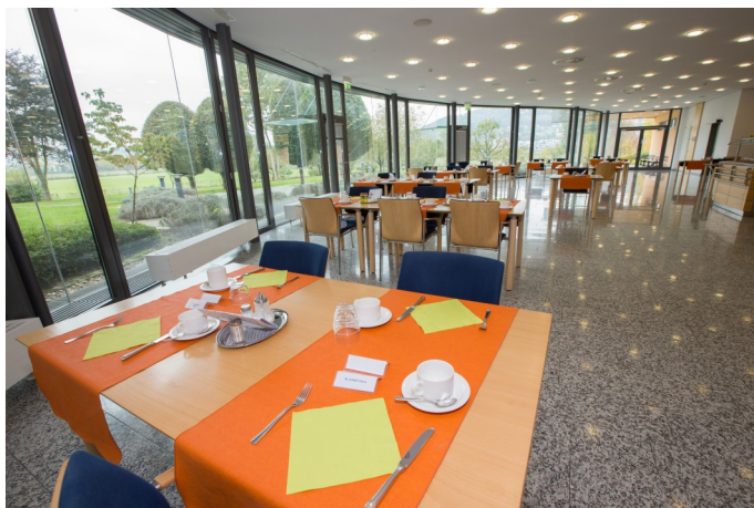
Restaurant Marie Consolatrice

Chacune des trois structures a son propre restaurant. Les repas sont pris au restaurant et l'aide est donnée aux résidents qui en ont besoin