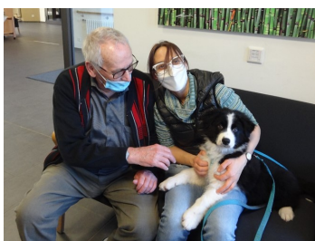
Divers animaux à la MAREDOC

Des activités spéciales qui apportent bonheur et plaisir sont organisées avec le chien « Scotty » pour nos résidents.